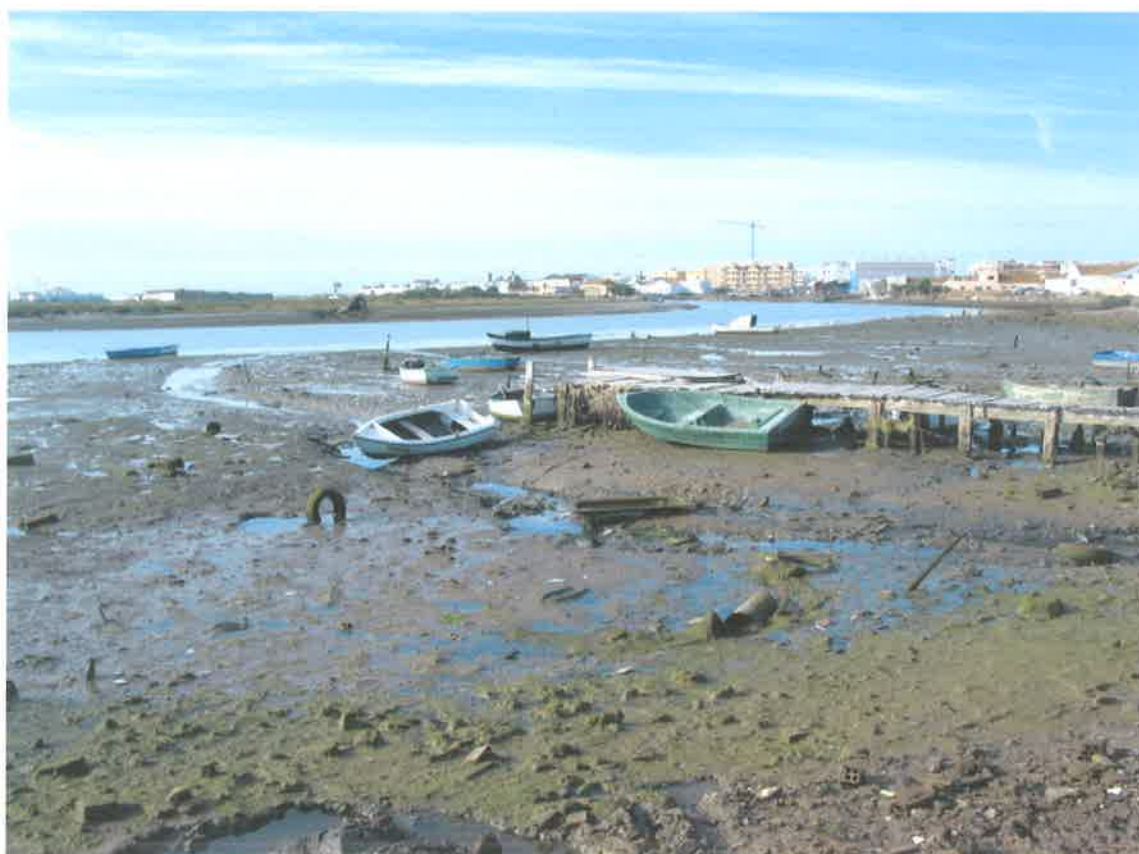
Terrenos próximos a Barbate