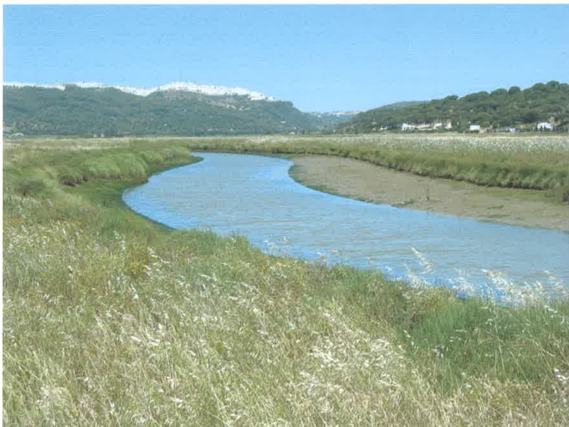
Paraje de Las Angosturas de El Soto