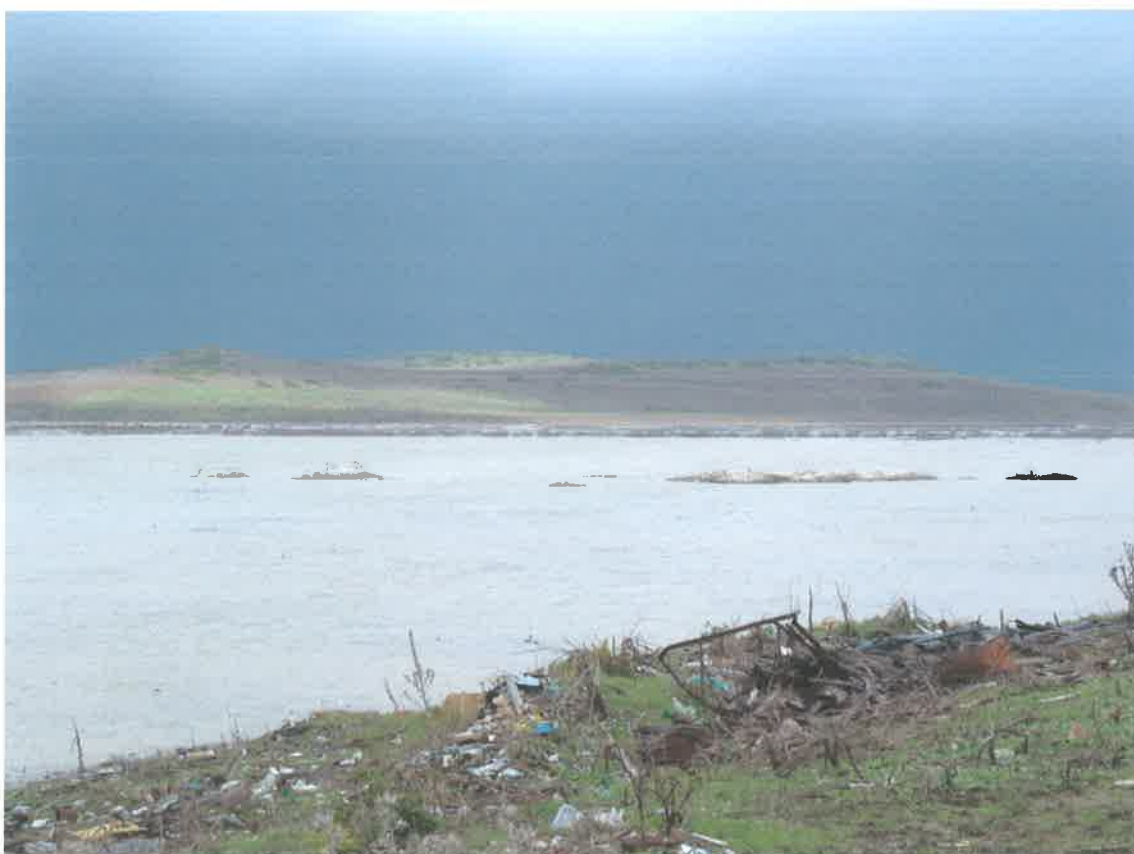
Zona de marisma con la pleamar