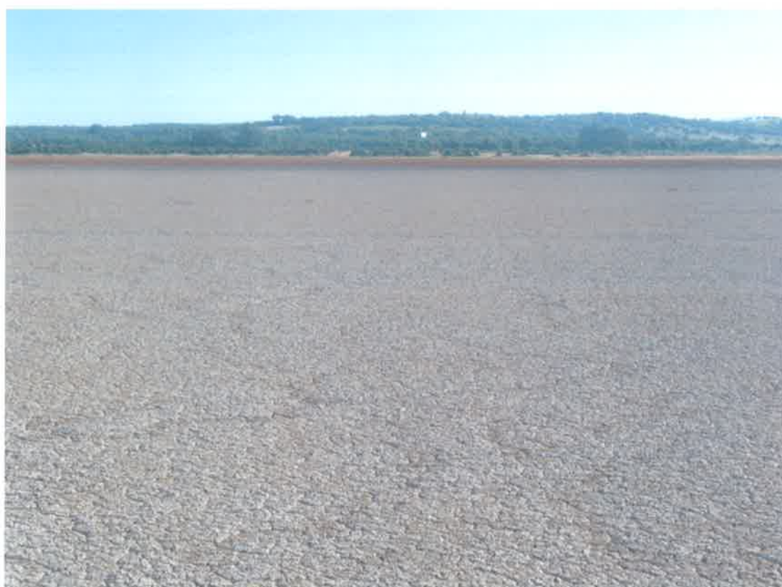
Terrenos de marisma