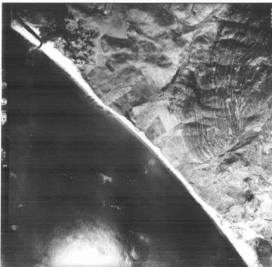
Fotografía aérea. Vuelo Americano, 1956. Desembocadura del río Barbate.