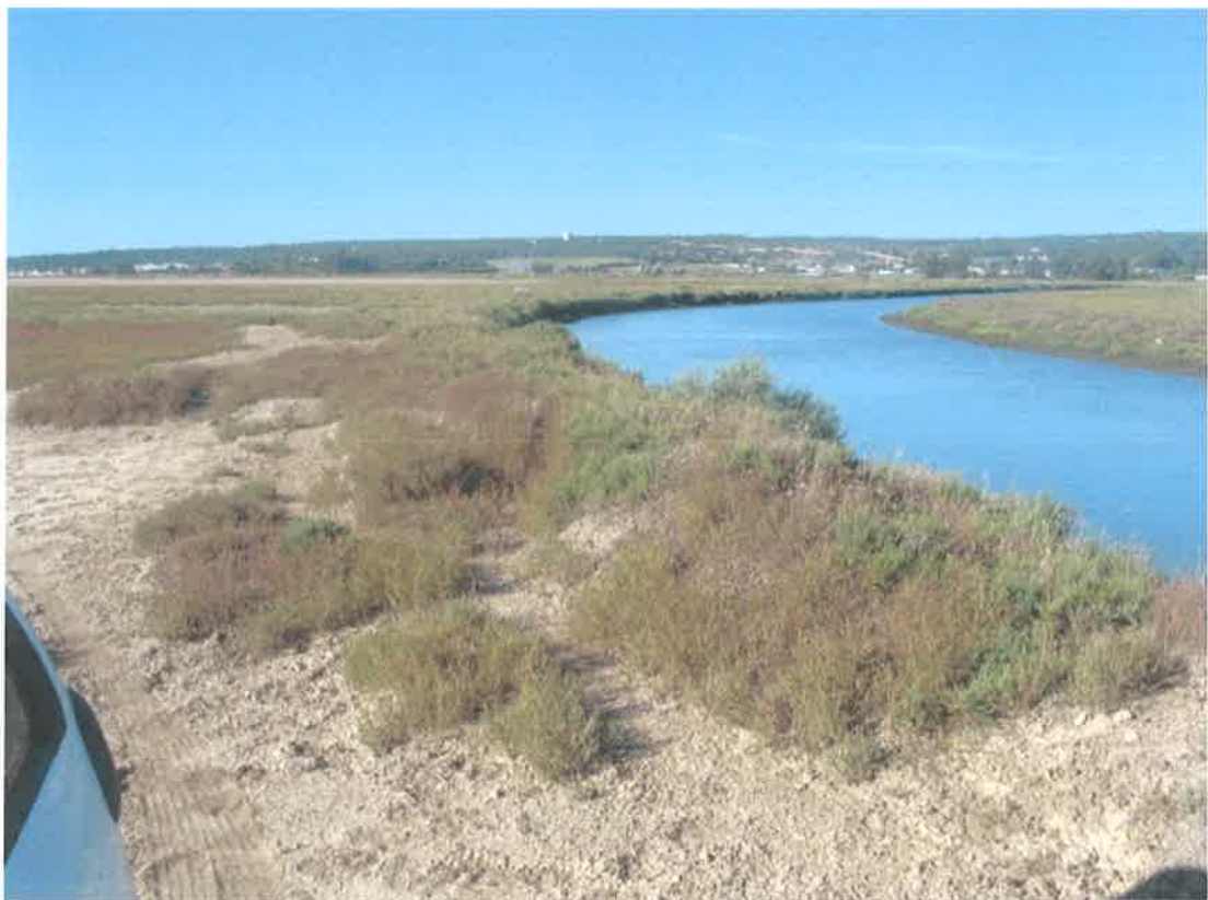
Terrenos de marisma en las márgenes del río Barbate