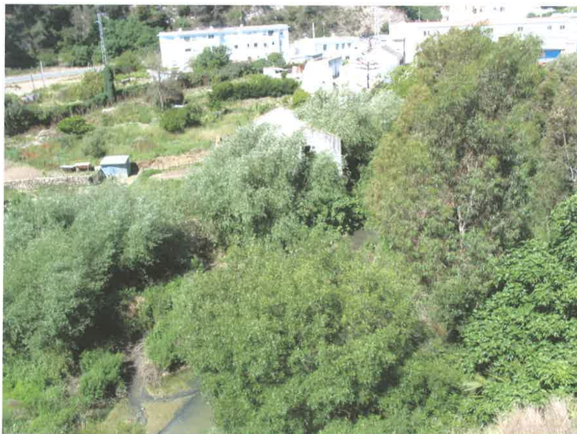
La Barca de Vejer