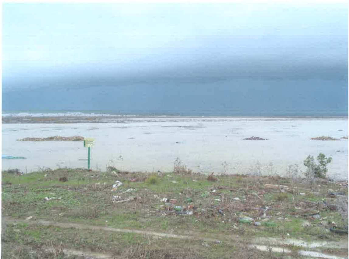
Pleamar en la marisma. Al fondo Barbate