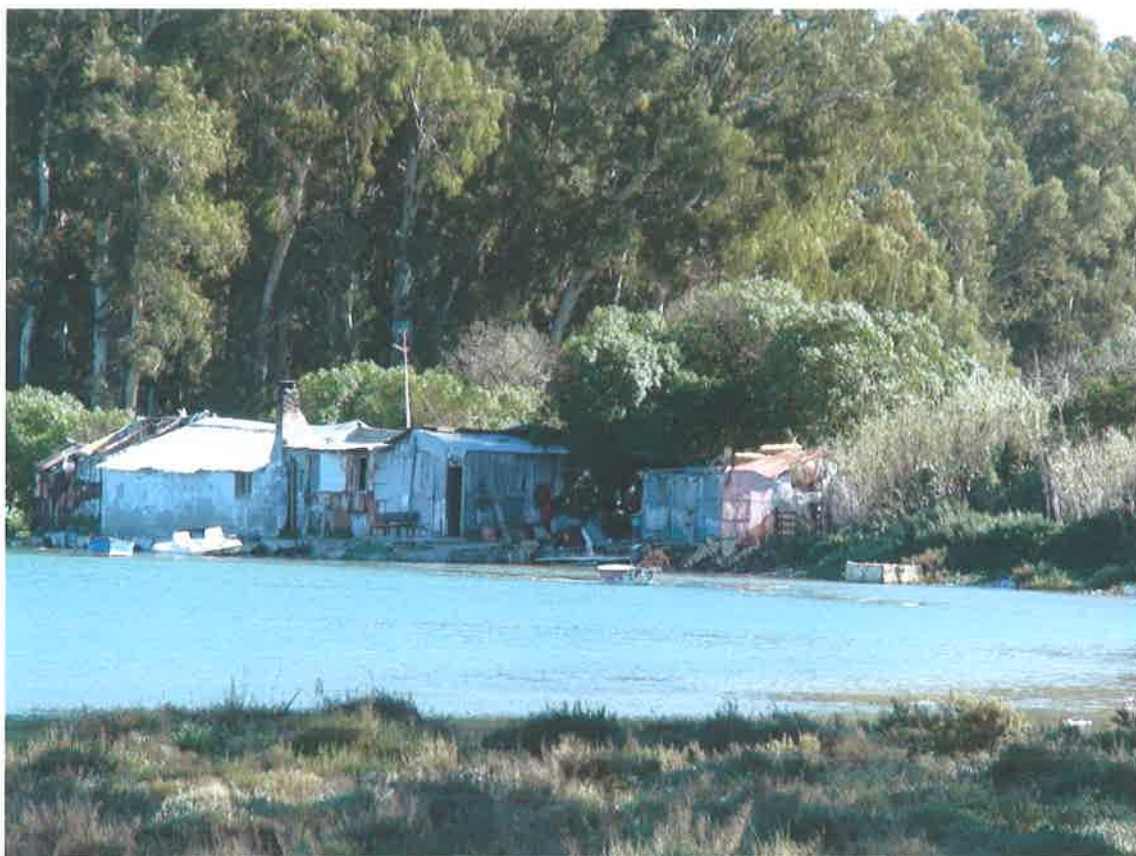
Chabolas en la zona de Montano