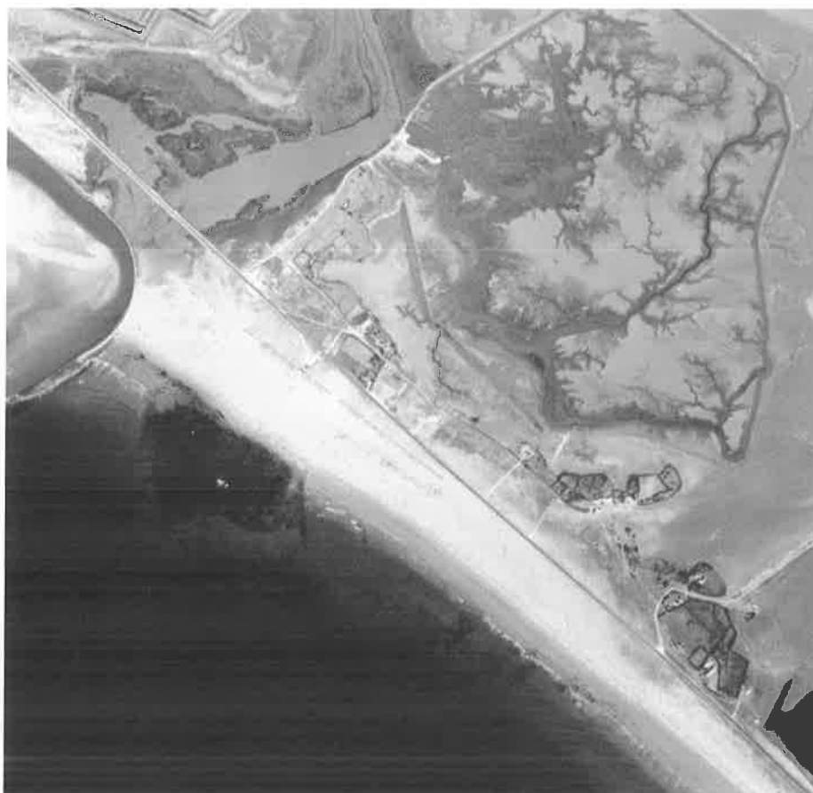
Detalle de la zona de El Cañillo.