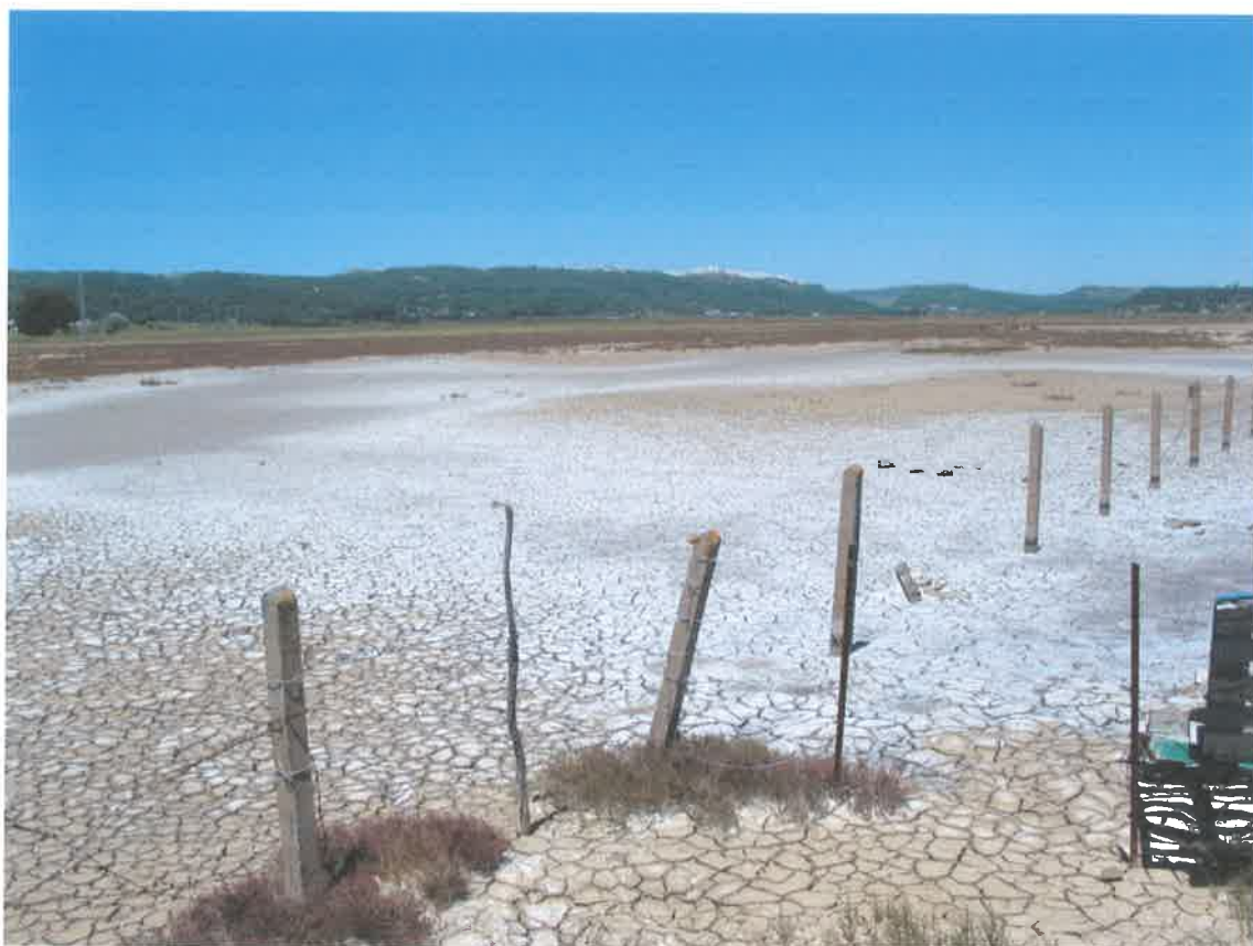
Marismas de Barbate. Al fondo Vejer de La Frontera