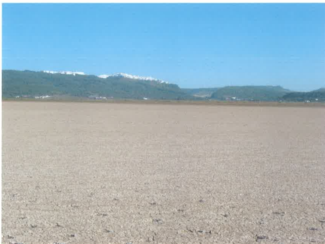
Marismas de Barbate y al fondo Vejer de La Frontera