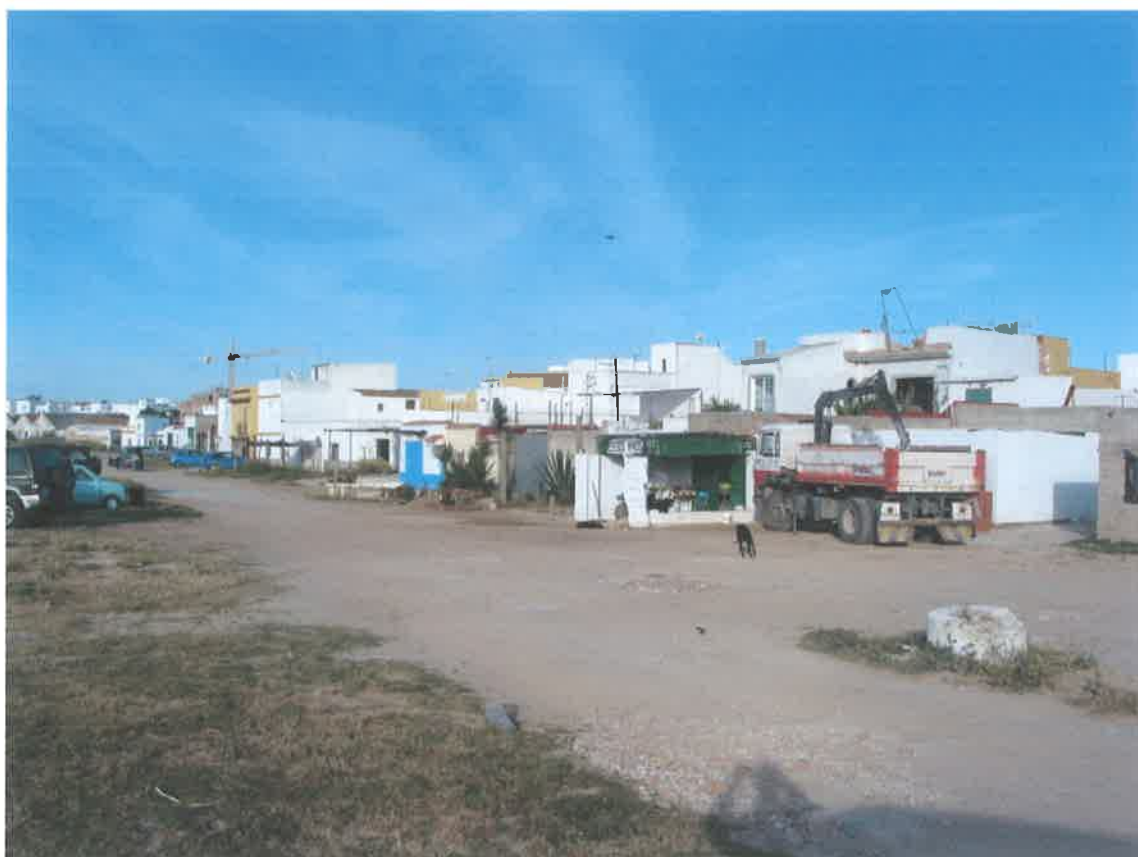
Inicio del tramo en Barbate