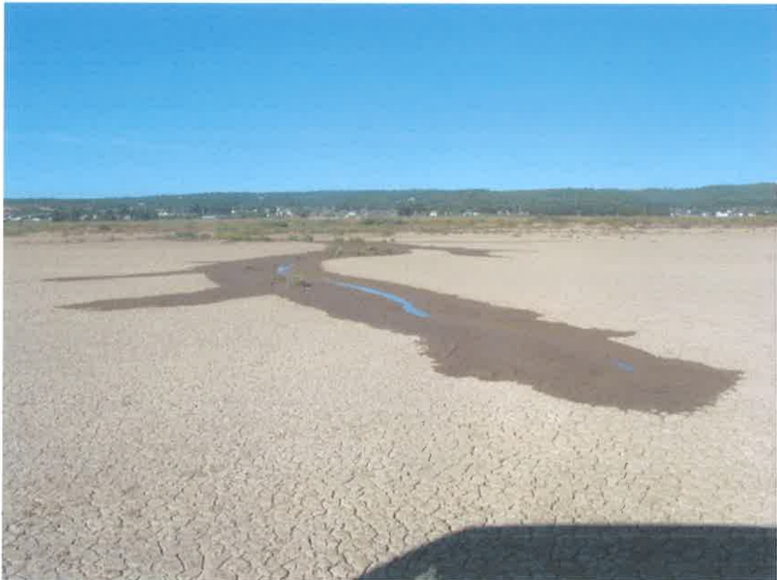
Terrenos de marisma