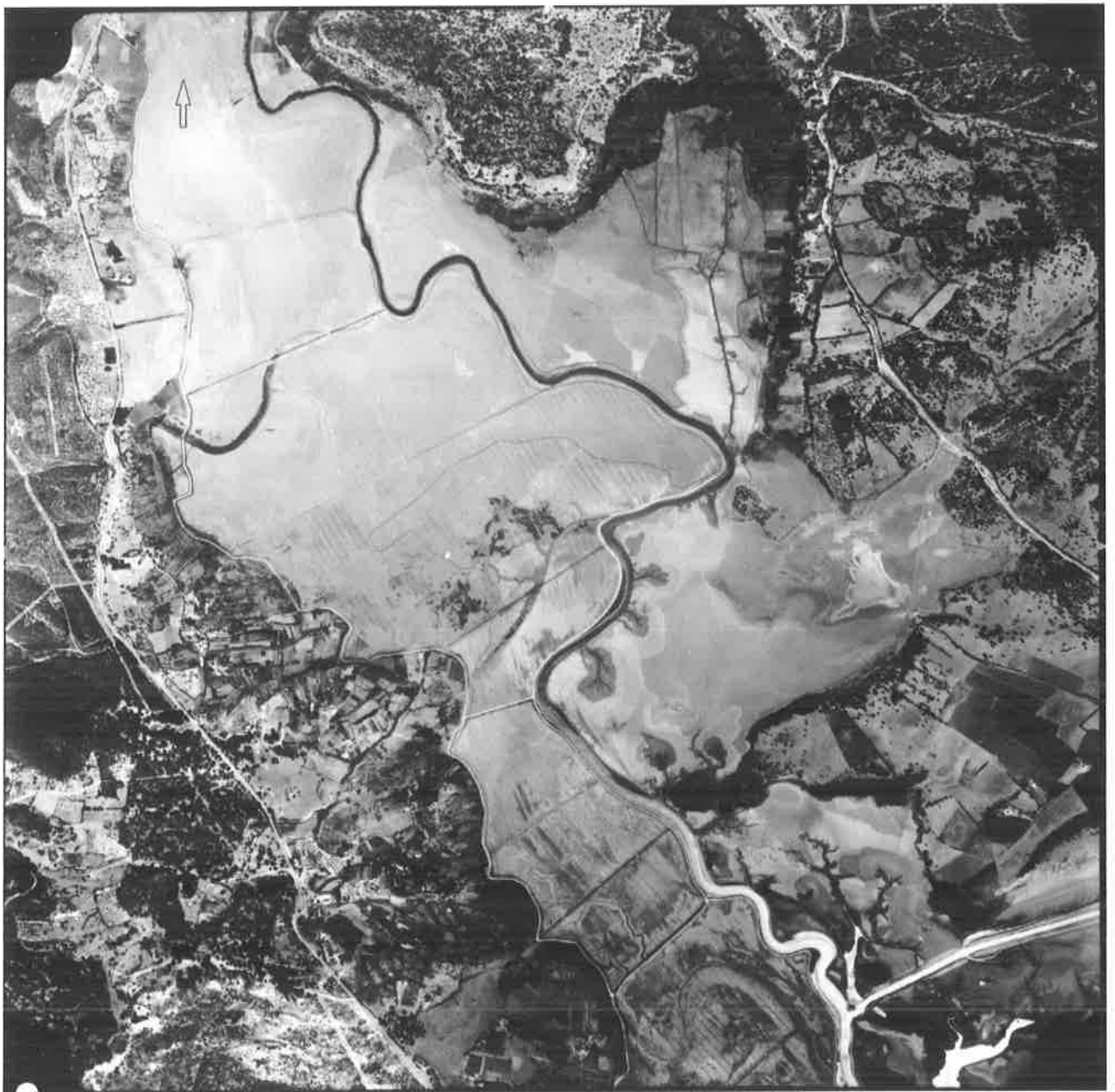
Fotografía aérea. IRYDA, 1977. Zona alta de las marismas y zona de los denominados "Huertos del Soto".