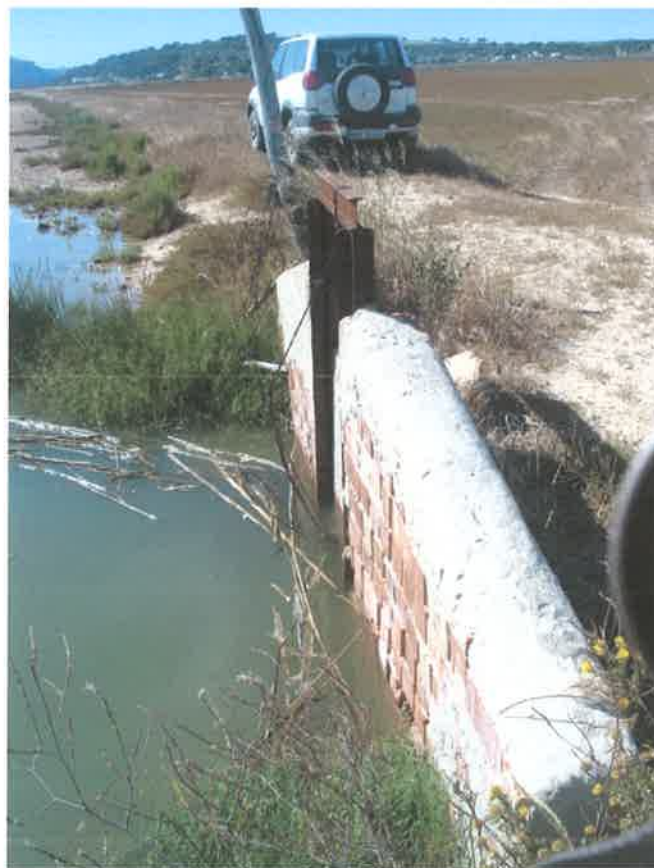
Compuerta que controla la entrada de mareas en la zona de El Soto