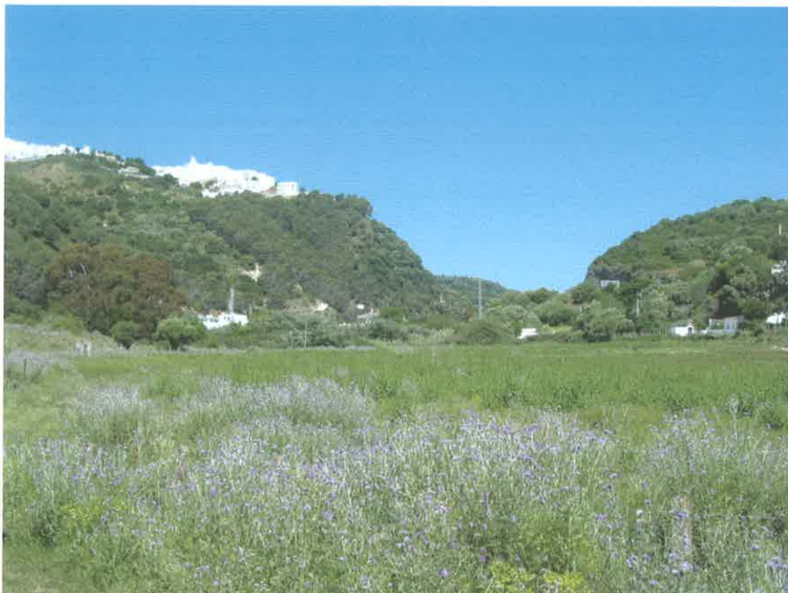
Zona de La Barca de Vejer