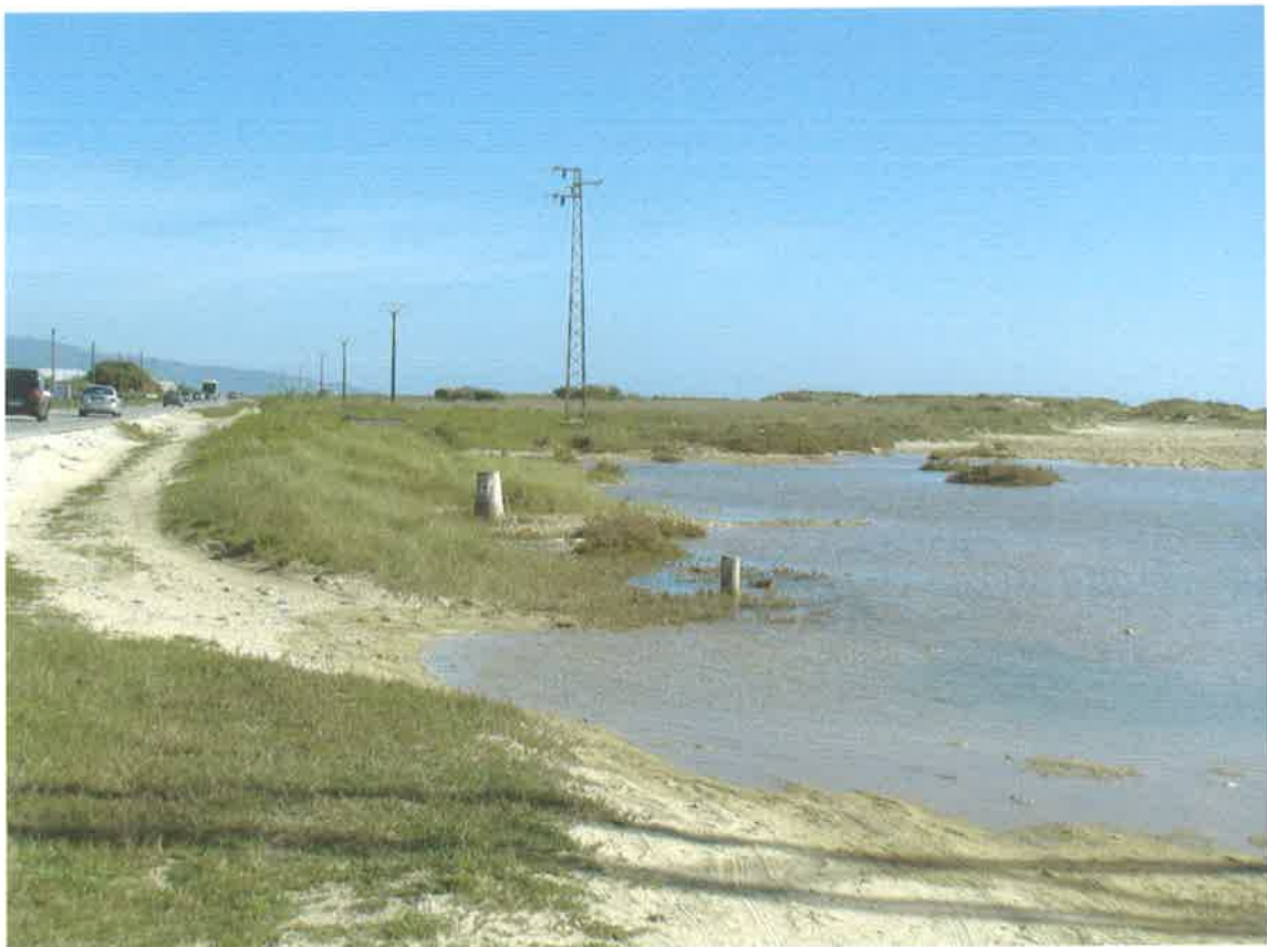
Final del tramo a la entrada de El Cañillo