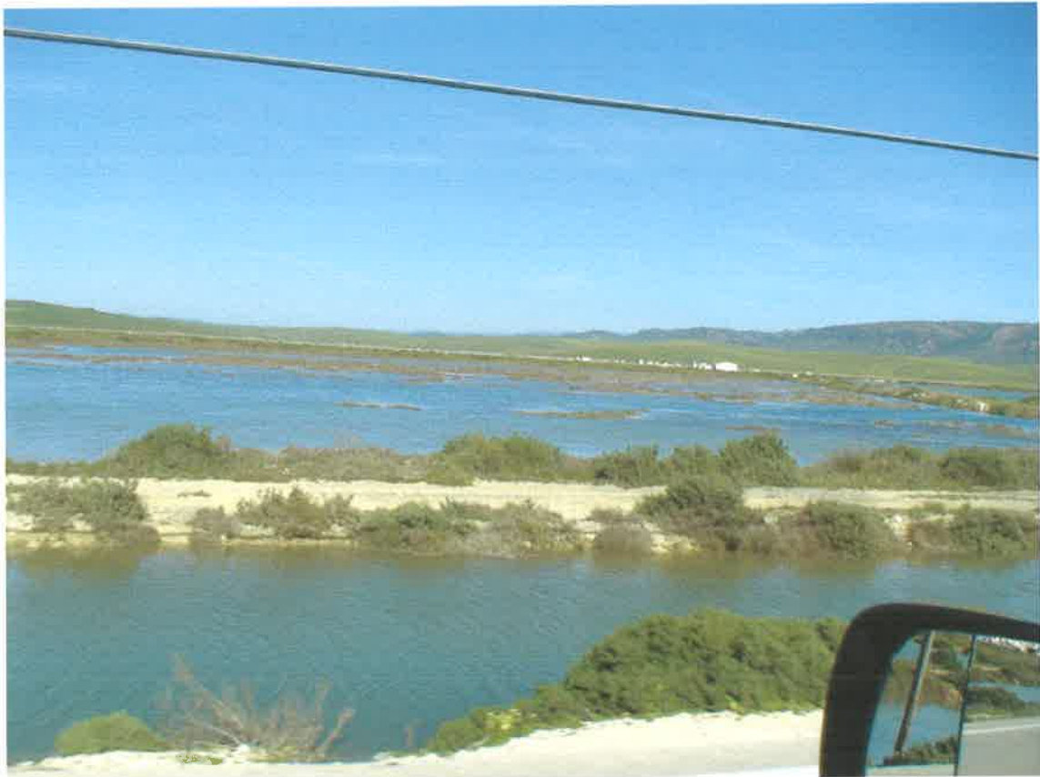
Margen izquierda de la carretera de Barbate a Zahara de Los Atunes