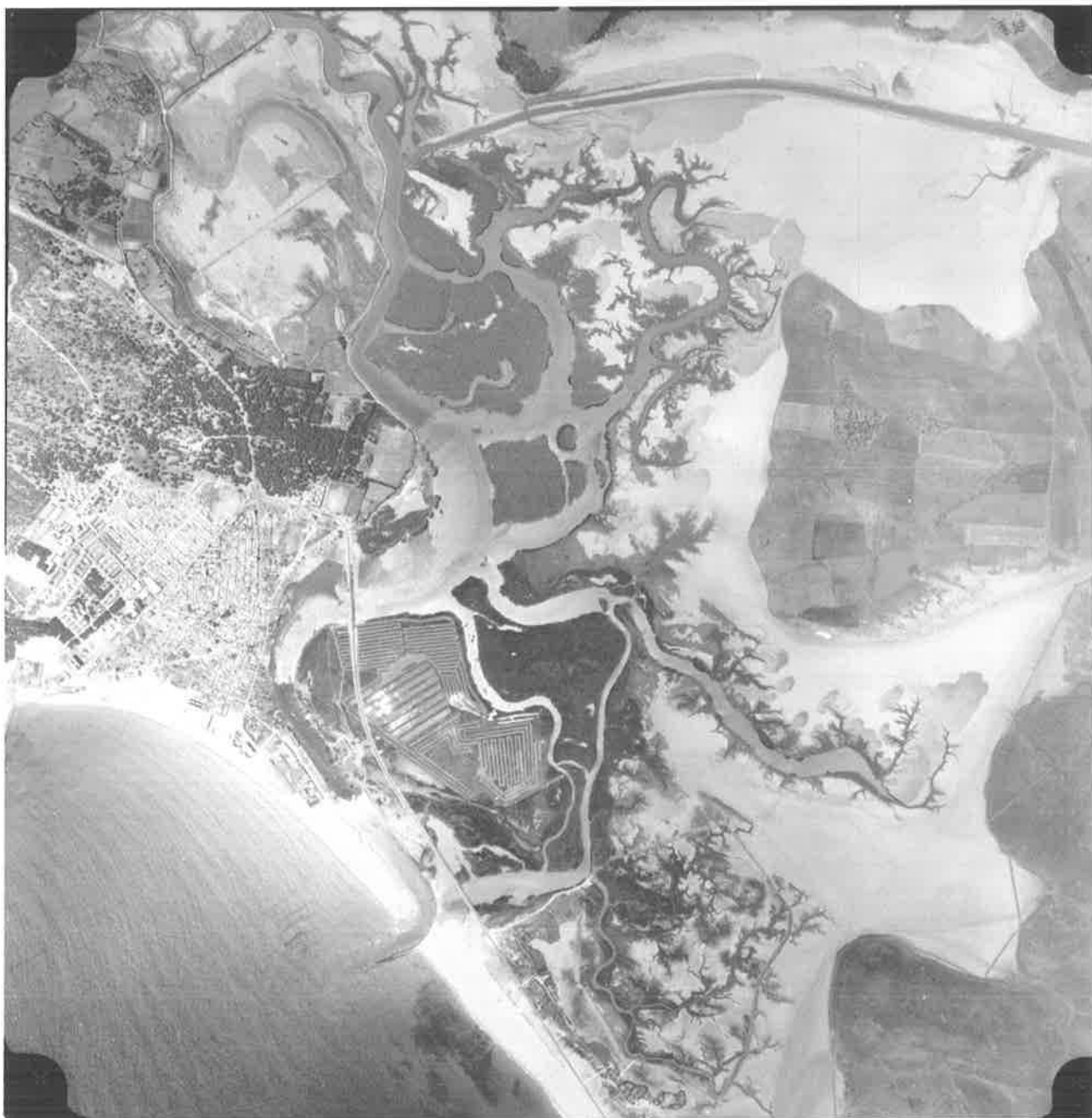
Fotografía aérea. MOPU, 1974. Vista general de las marismas de Barbate.