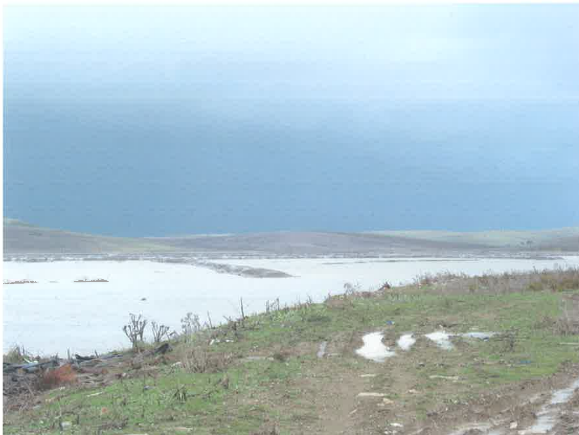
Pleamar en la marisma de Barbate