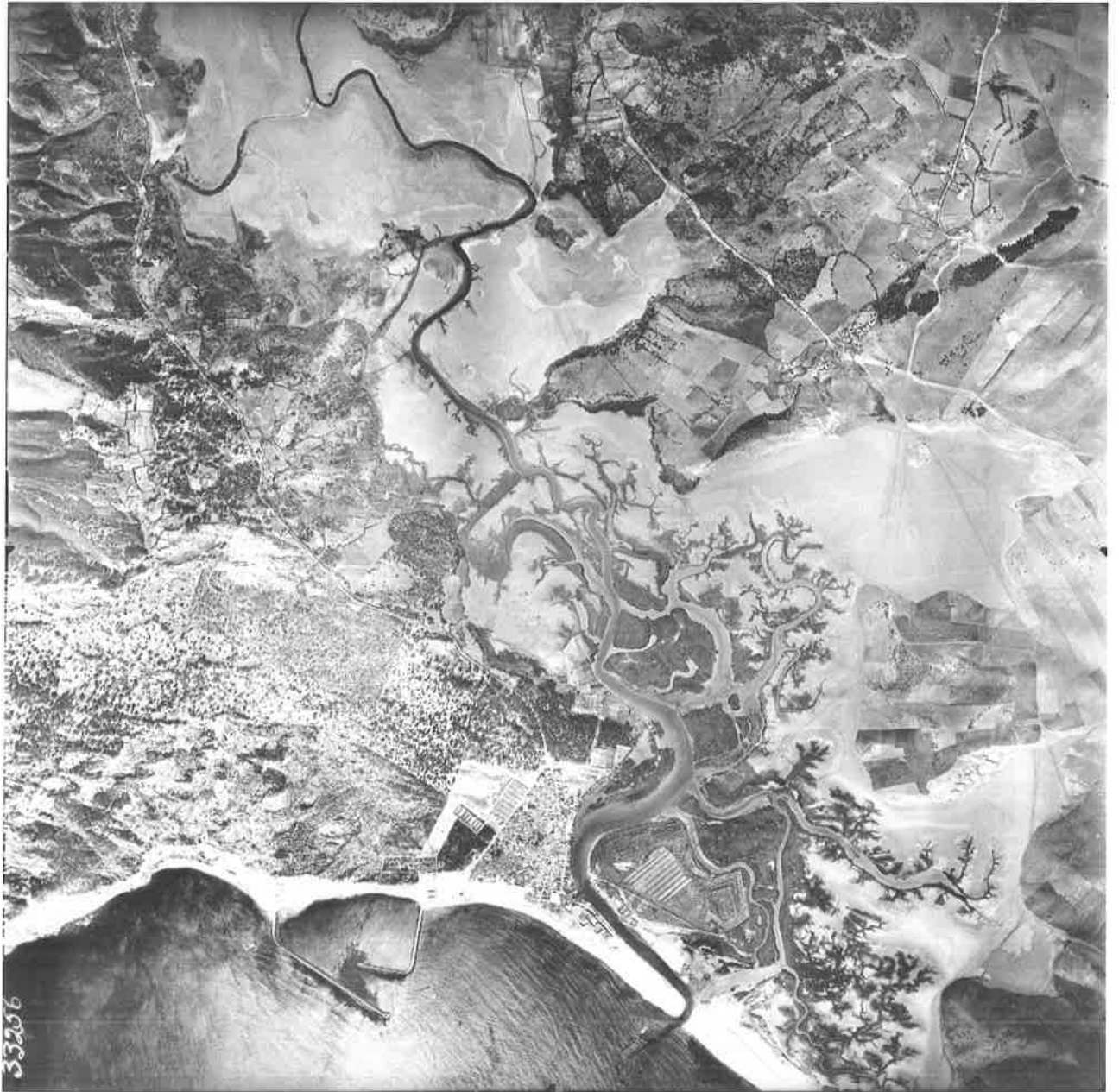
Fotografía aérea. Vuelo Americano, 1956. Vista general de las marismas de Barbate.