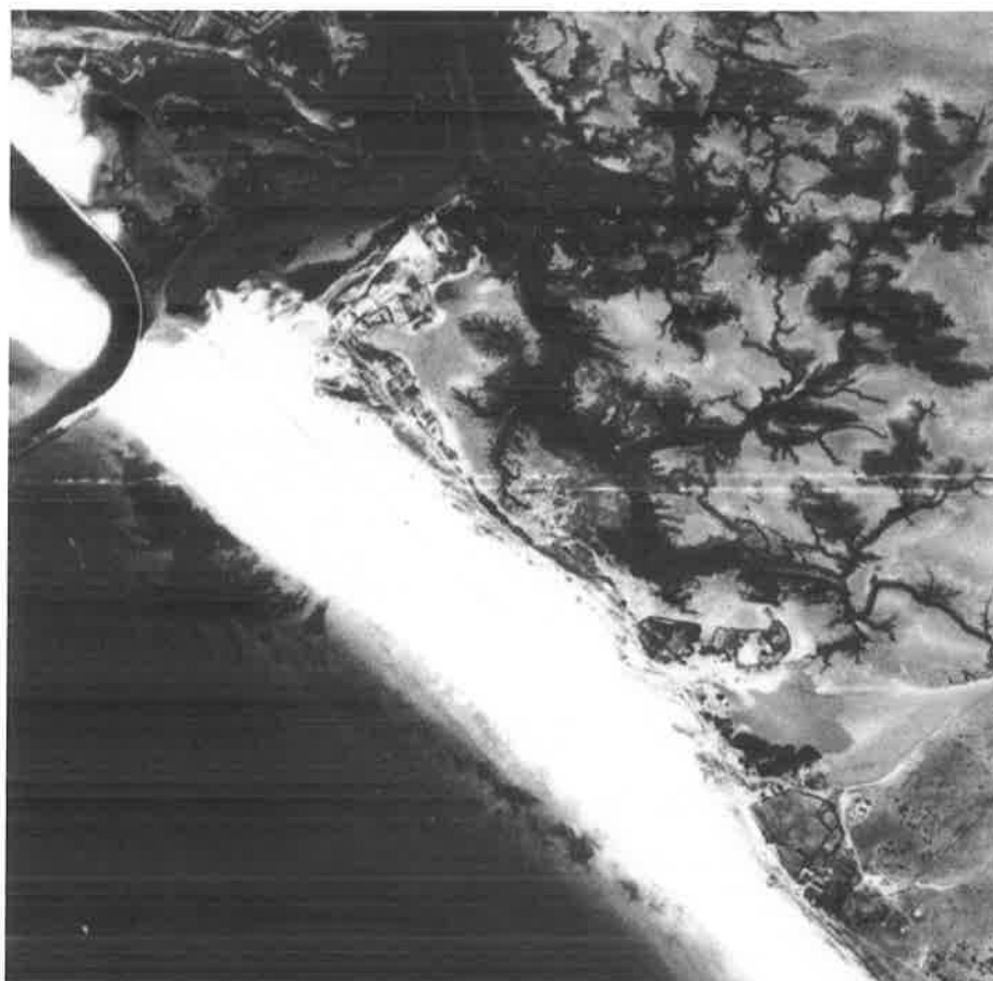
Detalle de la zona de El Cañillo.