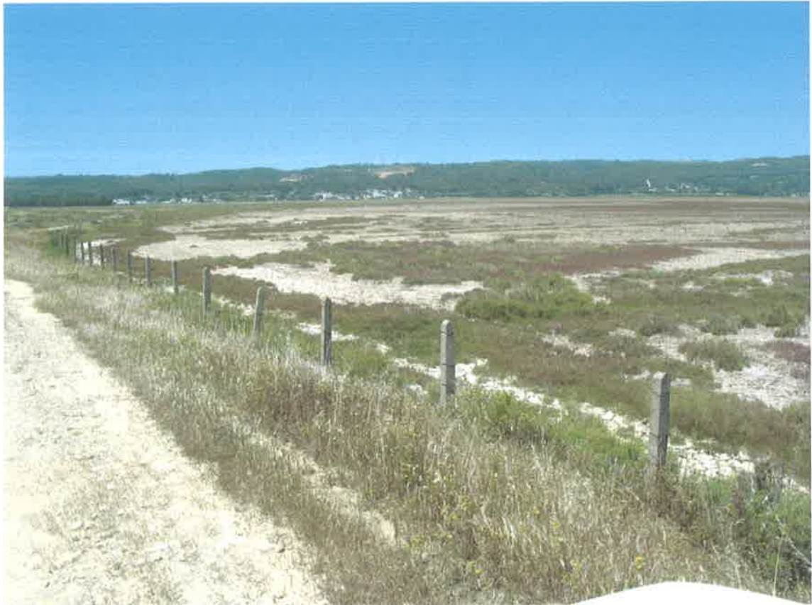
Vista parcial de la marisma desde camino