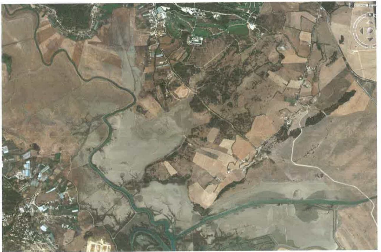
Vista aérea. Zona alta de la marisma y zona de los "Huertos del Soto"