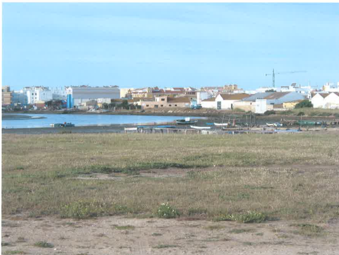
Zona próxima a Barbate