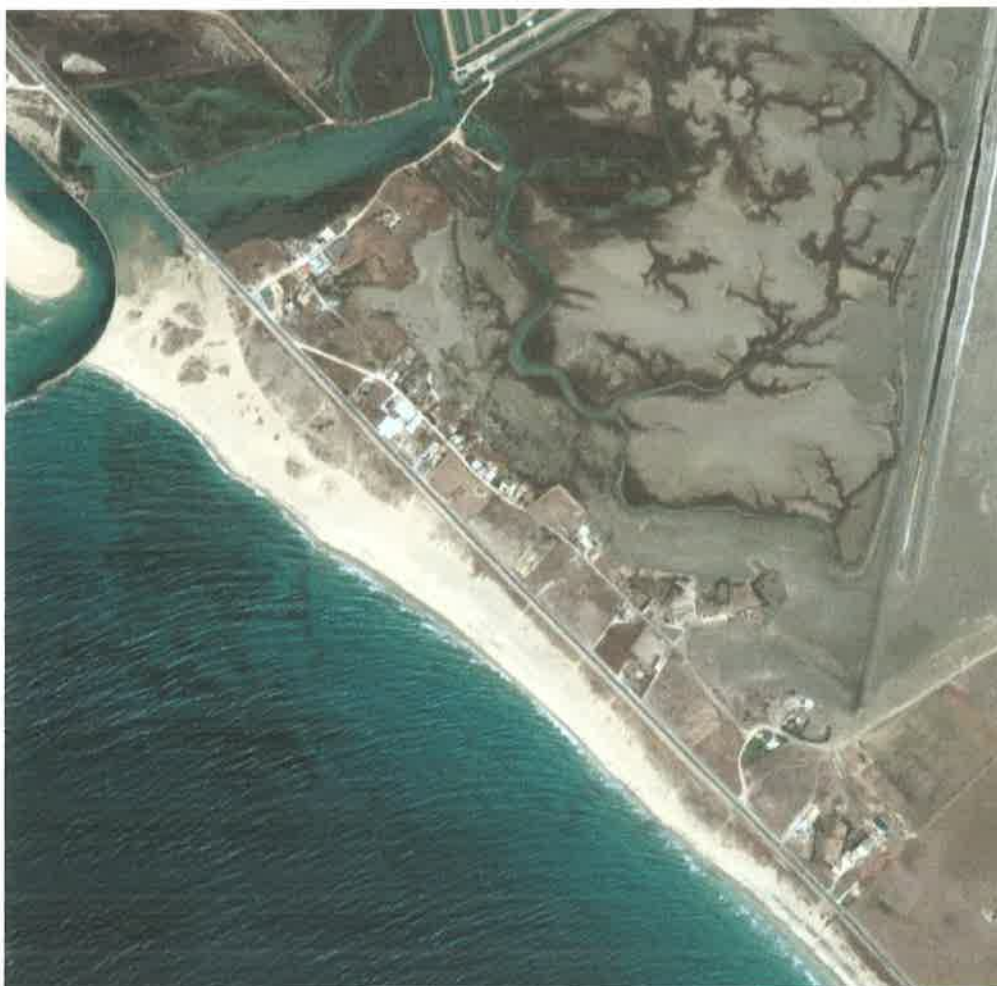
Detalle de la zona del Cañillo.