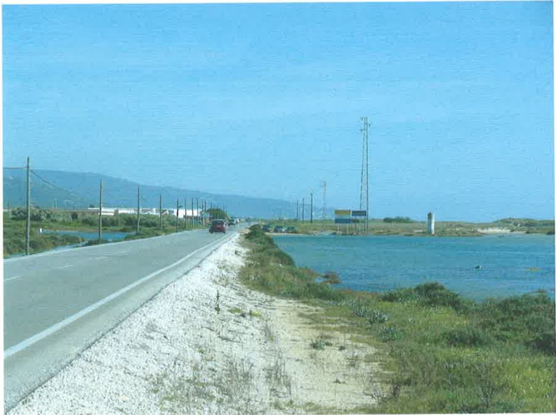
Carretera de Barbate a Zahara de Los Atunes a la entrada de El Cañillo