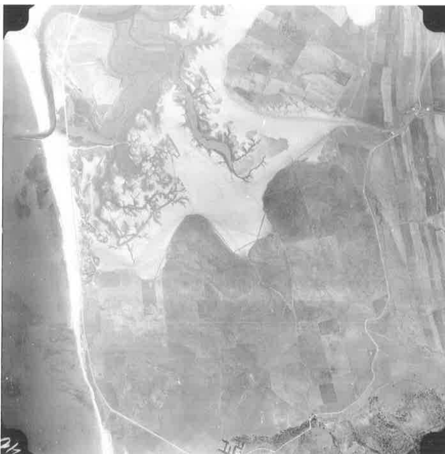
Fotografía aérea. Vuelo MOPU, 1974. Desembocadura del río Barbate.