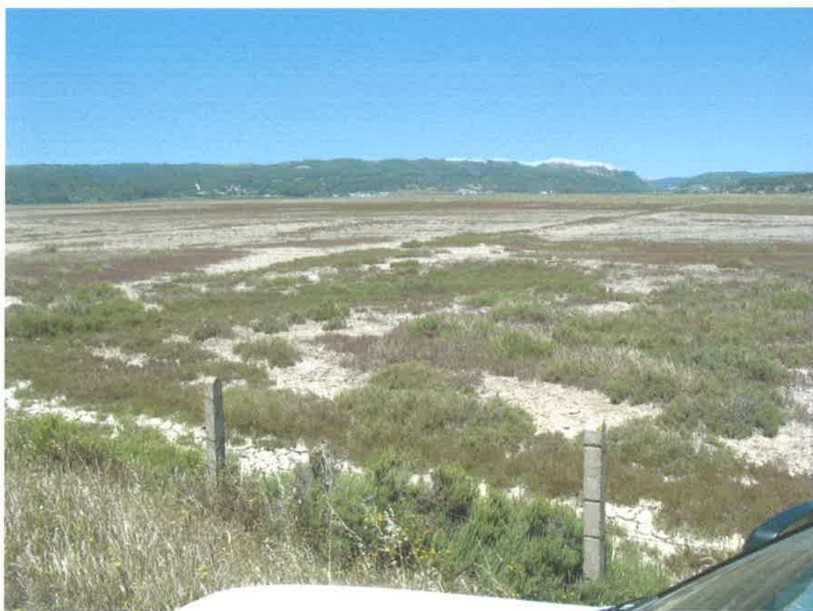
Vista general de la marisma