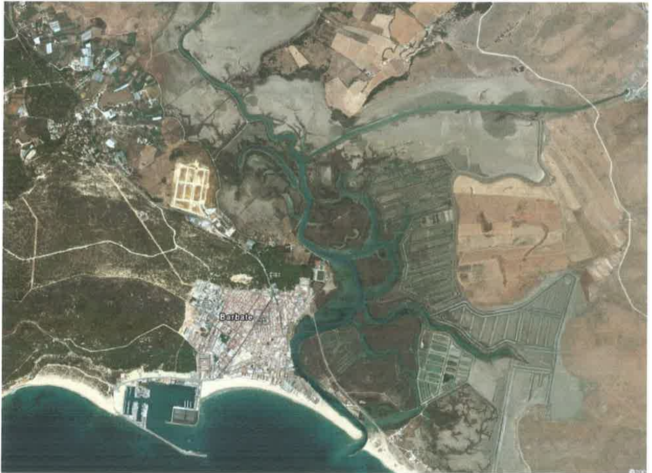
Vista aérea. Google Earth, 2007. Vista general de las marismas de Barbate.