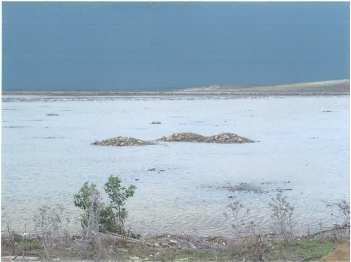
Terrenos de marisma en pleamar