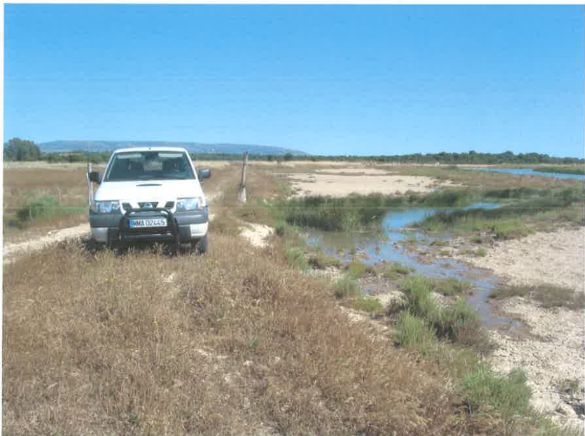
Marisma en la margen derecha del río Barbate