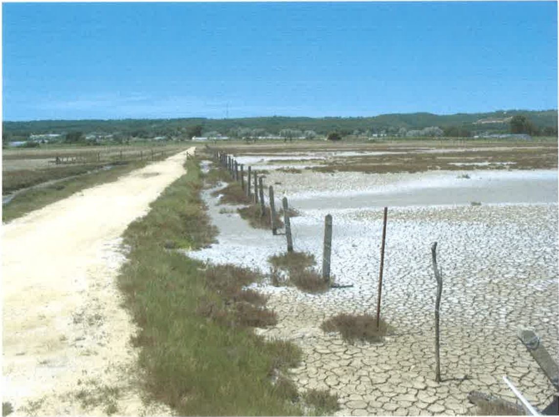
Zona de marisma con camino de acceso