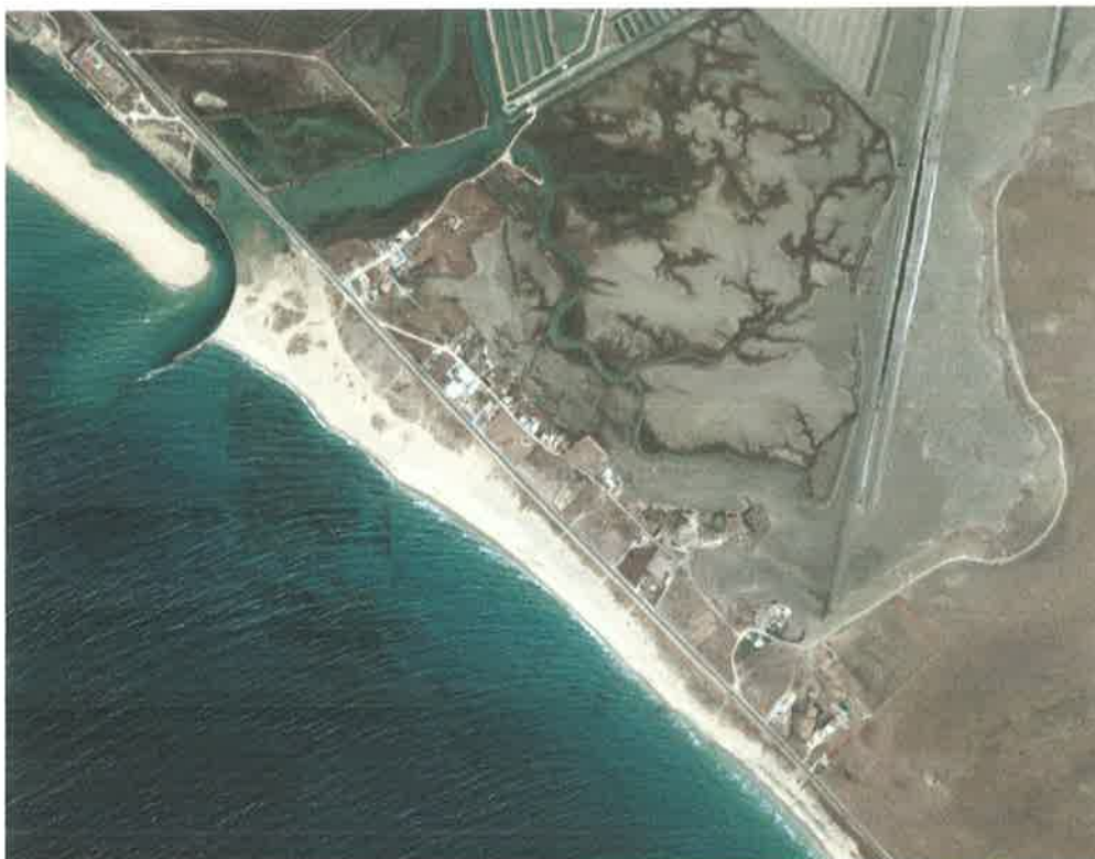
Vista aérea. Desembocadura del río Barbate.