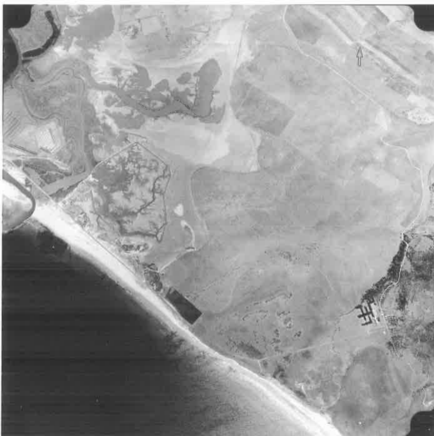
Fotografía aérea. Vuelo IRYDA, 1977. Desembocadura del río Barbate.