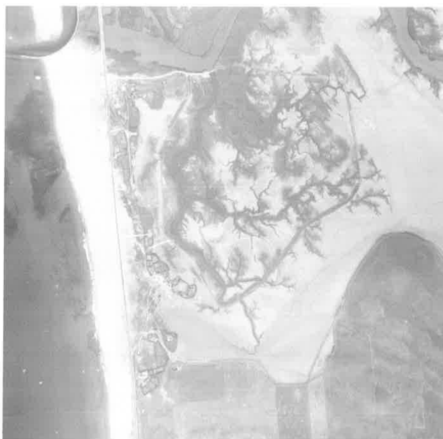
Detalle de la zona de El Cañillo.