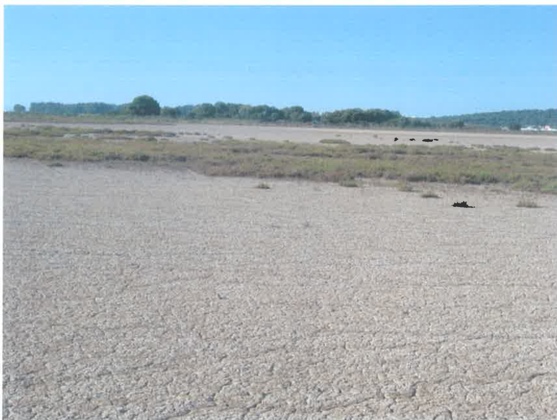
Zona de marisma