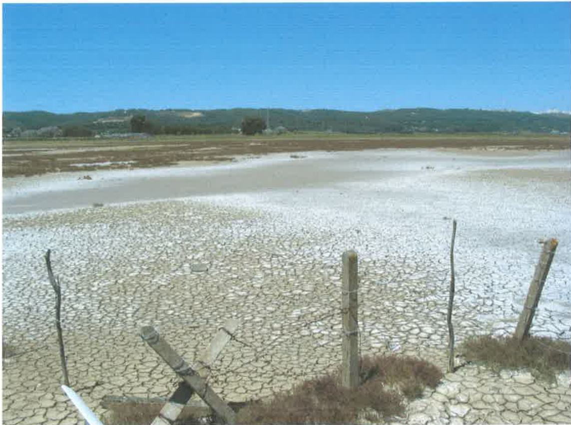
Zona de marisma