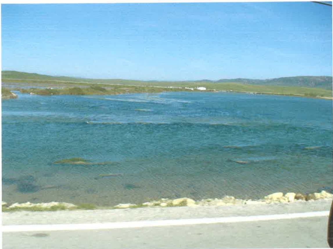
Zona de el Caño del Pajar