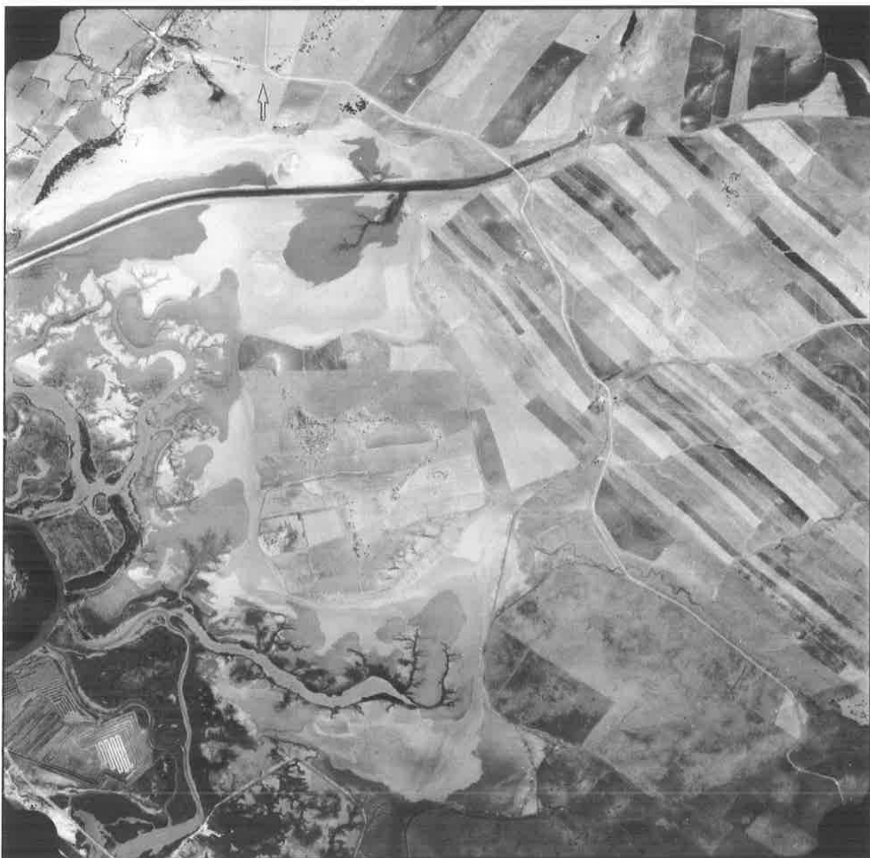
Fotografía aérea. IRYDA, 1977. Detalle del Canal de desagüe de la laguna de La Janda.