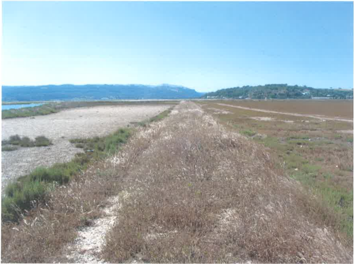
Zona de El Soto