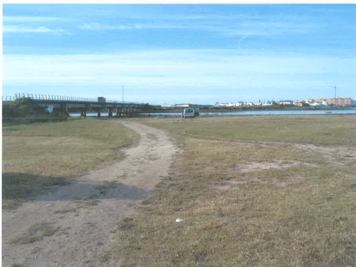
Terrenos en la Isla de San Paulino