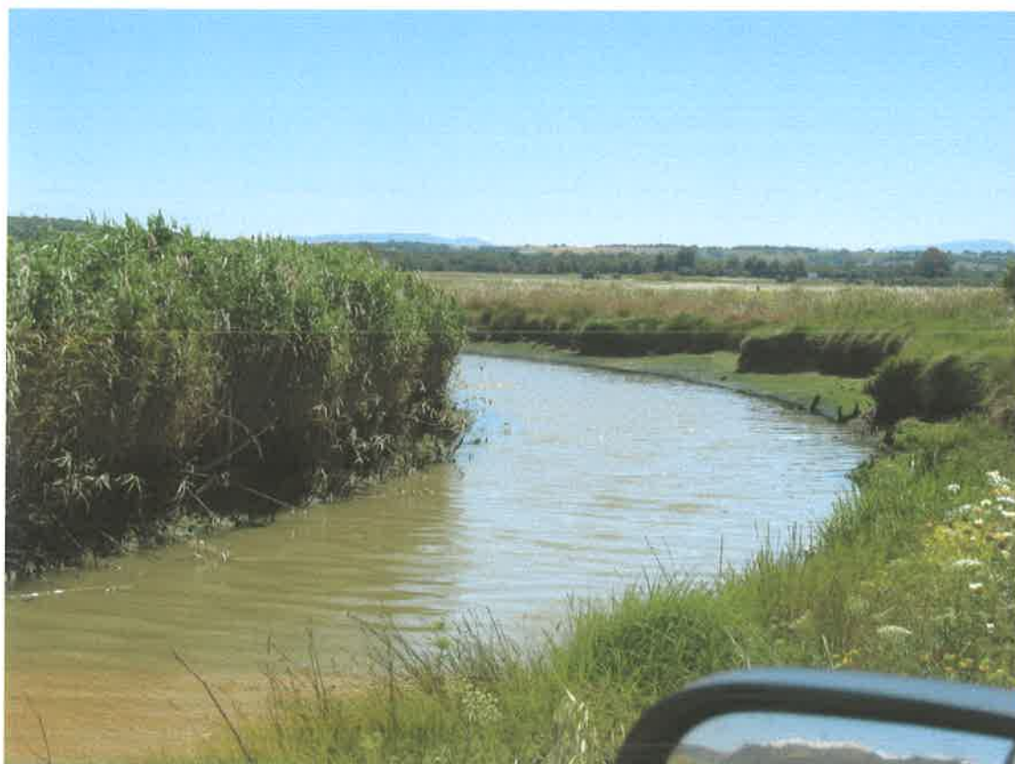
Cauce del río Barbate cerca de La Barca